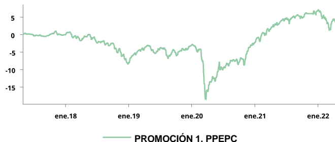
Gráfico del fondo